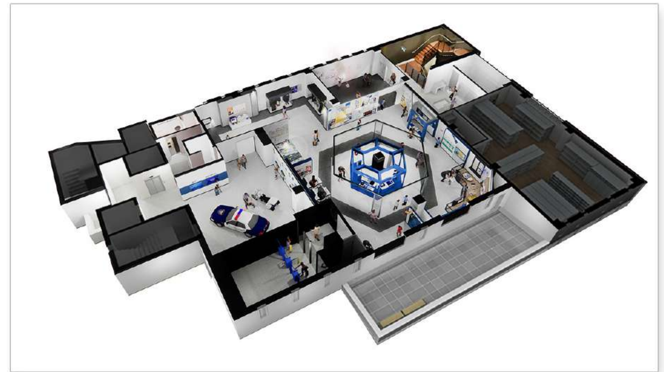
3층 경찰이해 · 체험실